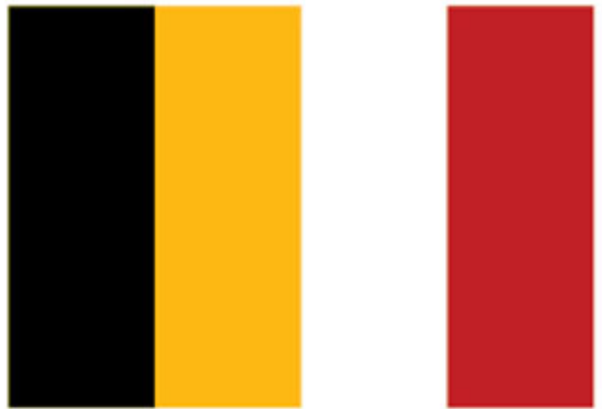
BLACK YELLOW WHITE RED