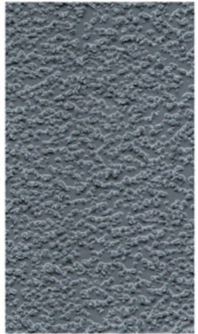
COARSE AGGREGATE - RAL 7001