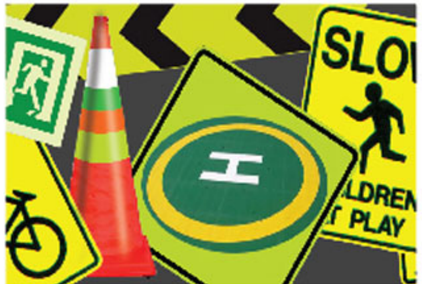
NATIONAL FLUORESCENT PAINT

For better reflectorization: Drop glass beads on wet film or Mix glass beads in the paints before application