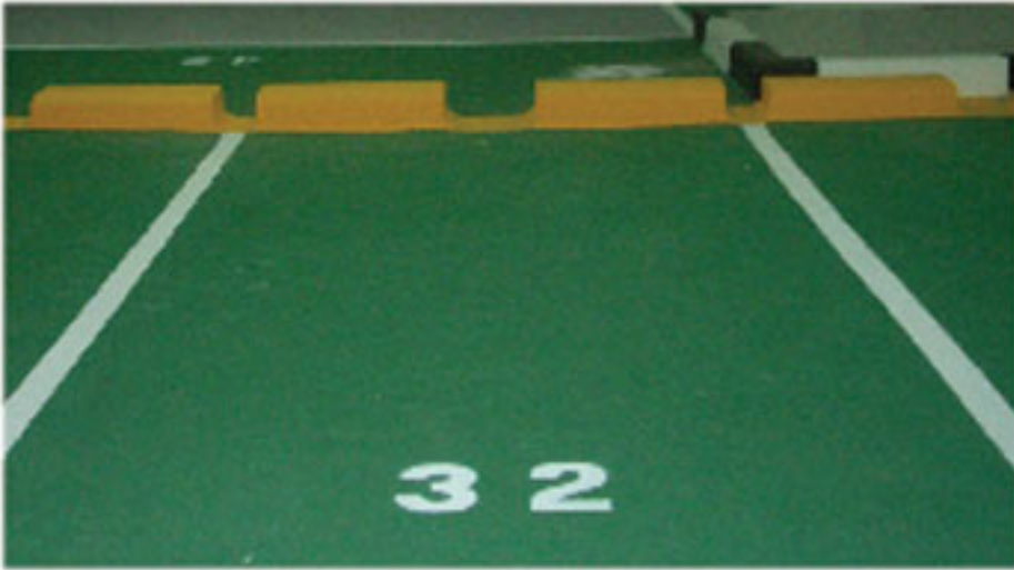
NATIONAL GUARD EPOXY FLOORING TOPCOAT