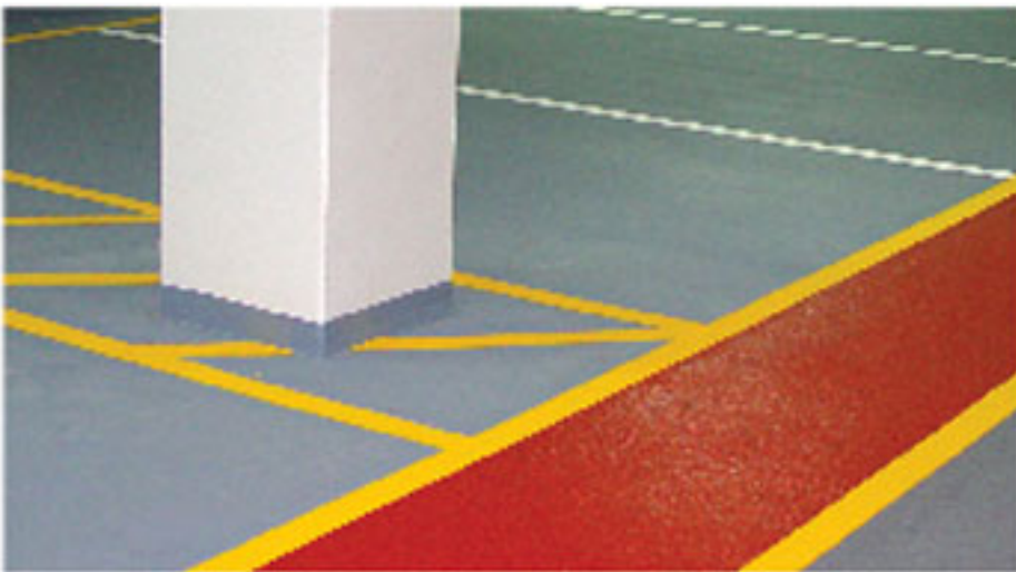
NATIONAL GUARD EPOXY FLOORING TOPCOAT S.F.