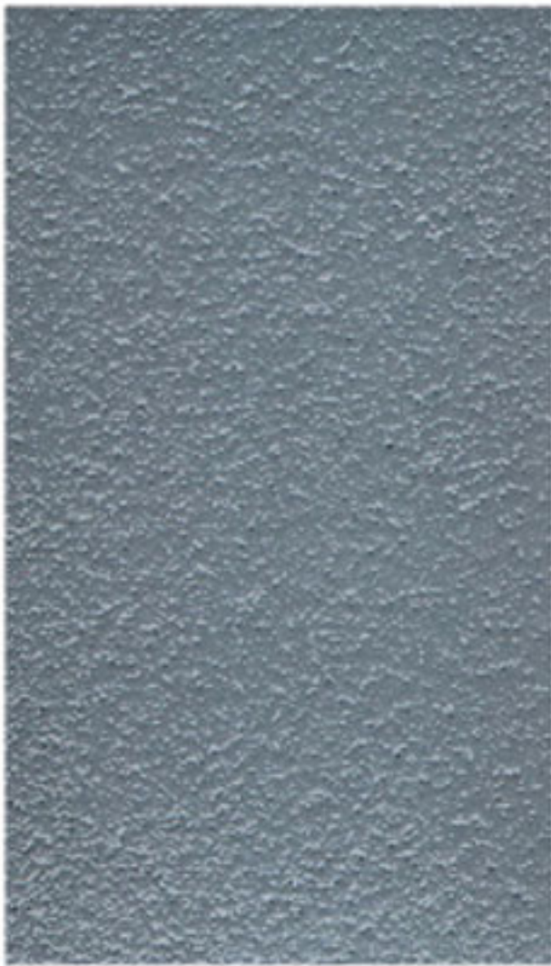
FINE AGGREGATE - RAL 7001