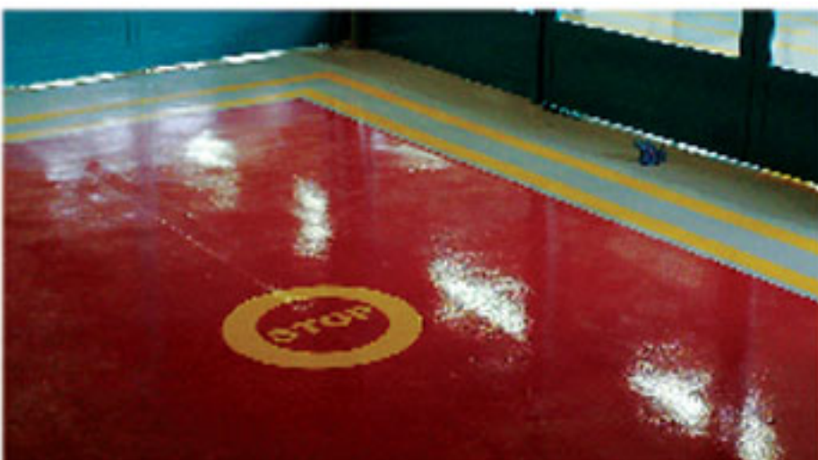
NATIONAL ALIPHATIC POLYURETHANE H.B.