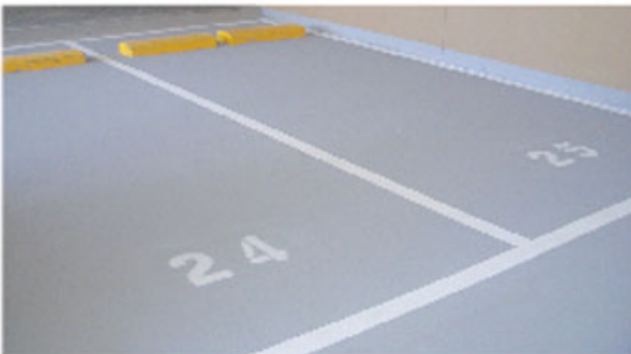
NATIONAL AQUA EPOXY TOPCOAT