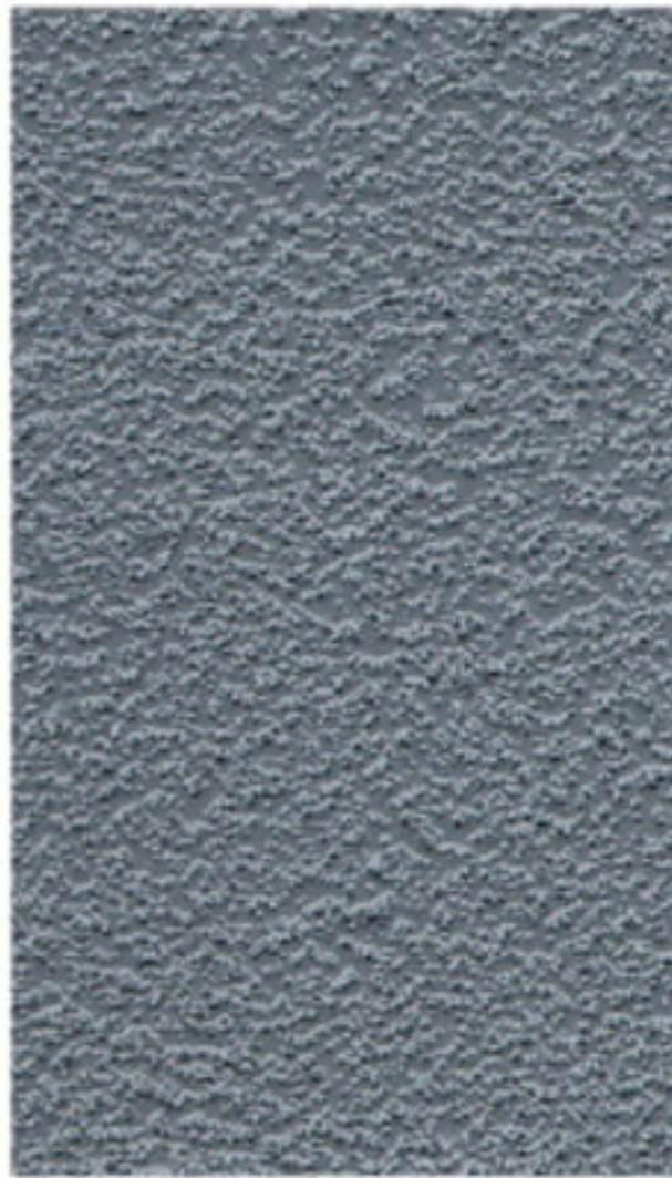
MEDIUM AGGREGATE - RAL 7001