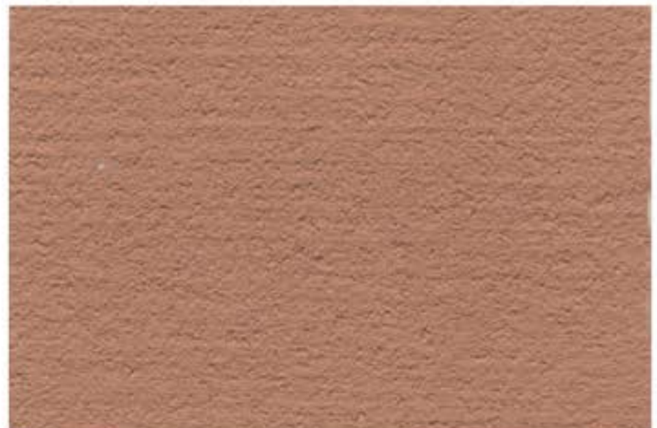
807 DEEP CREAM