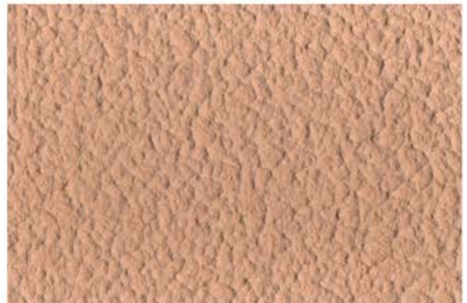
808 PEANUT BUTTER