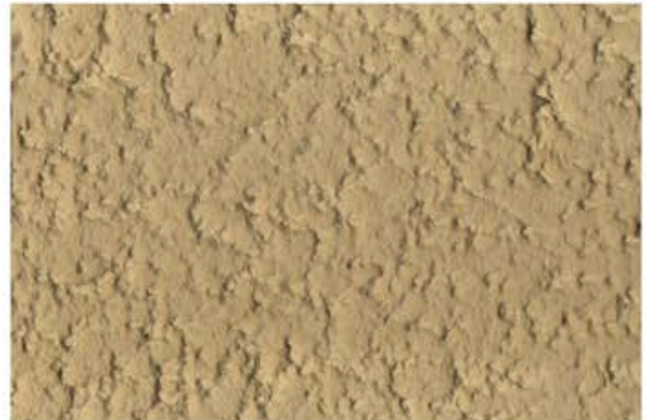
833 LIGHT YELLOW