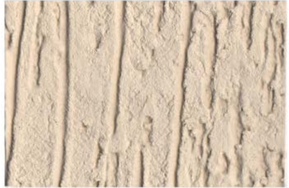
801 OFF WHITE