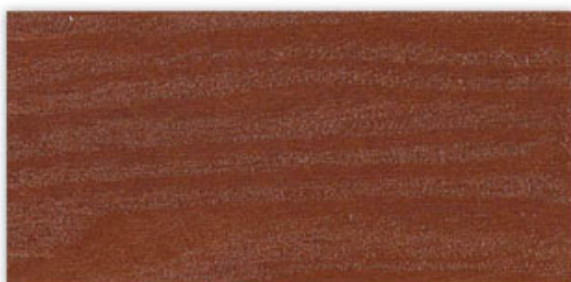
N-023 GOLD BROWN