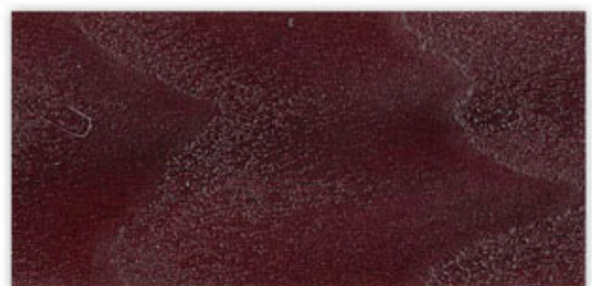
N-031 DARK MAHOGANY

This shade card supersedes all previous prints