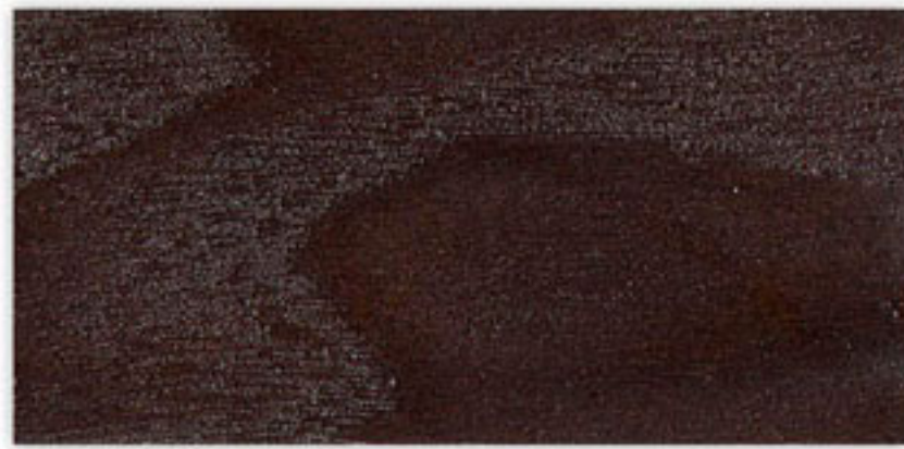
N-019 DARK WALNUT