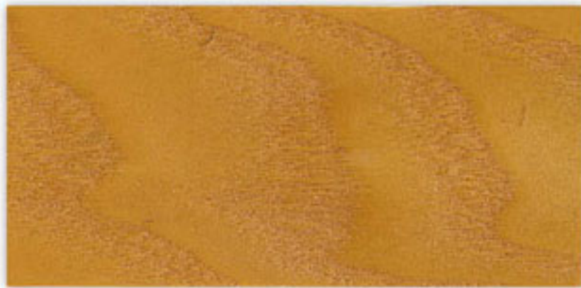
N-021 NATURAL OAK