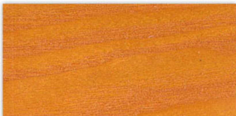
N-016 GOLD YELLOW